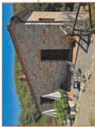
immagine n. 1

estratto della planimetria catastale - piano terreno - con evidenziato l'ingresso alla camera